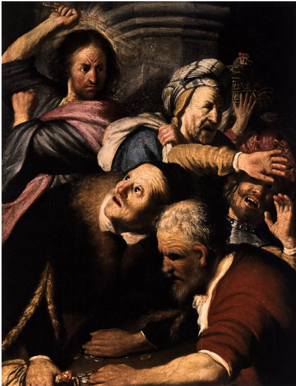
Rembrandt Van Rijn (1606-1669) – De tempelreiniging

Jezus sprak echter over de tempel van zijn lichaam. Toen Hij dan ook verrezen was uit de doden herinnerden zijn leerlingen zich dat Hij dit gezegd had, en zij geloofden in de Schrift en in het woord dat Jezus gesproken had. Terwijl Hij bij gelegenheid van het paasfeest in Jeruzalem was, begonnen er velen in zijn Naam te geloven bij het zien van de tekenen die Hij deed. Maar Jezus van zijn kant had geen vertrouwen in hen omdat Hij allen kende. Hij wist wat er in de mens stak en daarom was het niet nodig dat iemand Hem over de mens inlichtte.