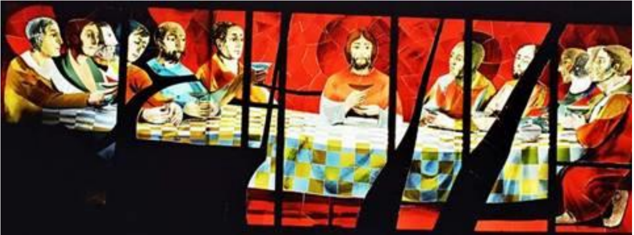
Glasraam 'Het Laatste Avondmaal: de instelling van de Eucharistie' - Jean-Marie Pirot (Arcabas) – Notre-Dame des Neiges / Alpe d'Huez

tot de dag komt dat ik er opnieuw van zal drinken in Gods koninkrijk.' Nadat ze de lofzang hadden gezongen, vertrokken ze naar de Olijfberg.