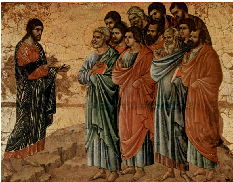
Christus op de berg van Galilea - Duccio di Buoninsegna (ca 1255-1318) Museo dell'Opera del Duomo, Siena, Italië