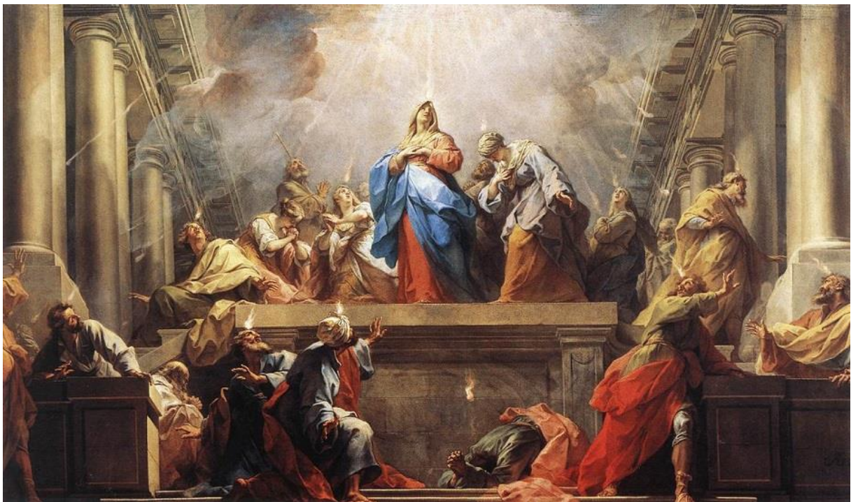
PENTECOST (1732) - Jean II Restout, Franse schilder (1692-1768) Olieverf op canvas, Musée du Louvre, Paris

Nog veel heb Ik u te zeggen, maar gij kunt het nu nog niet dragen. Wanneer Hij echter komt, de Geest der waarheid, zal Hij u tot de volle waarheid brengen. Hij zal niet uit zichzelf spreken maar spreken al wat Hij hoort en u de komende dingen aankondigen. Hij zal Mij verheerlijken omdat Hij aan u zal verkondigen wat Hij van Mij ontvangen heeft. Daarom zei Ik dat Hij aan u zal verkondigen wat Hij van Mij ontvangen heeft. Al wat de Vader heeft is het mijne.'